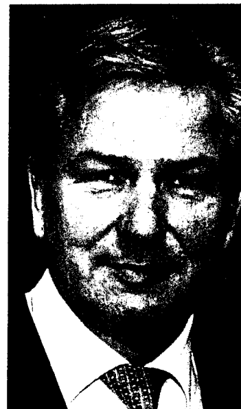
Klaus Wowereit, Regierender Bürgermeister von Berlin, unterstützt die Gütersloher Sozialdemokraten am 24. August.