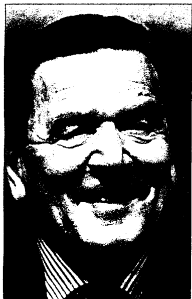
Mit Vertretern der Wirtschaft spricht Ex-Bundeskanzler Gerhard Schröder am kommenden Donnerstag in Marienfeld.